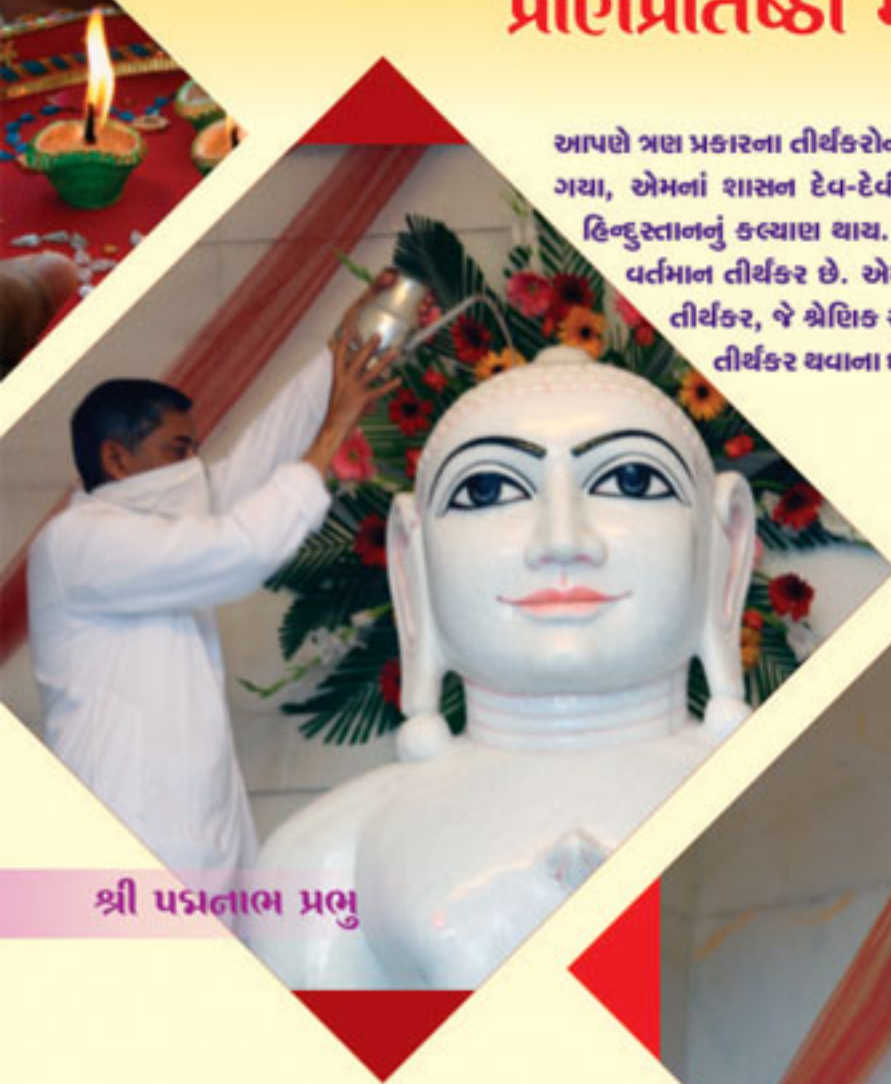
શ્રી પદ્મનાભ પ્રભુ

અમને કો'ક પૂછે કે, 'અમે દુઃખી છીએ તો અમારે શું કરવું ? કોને ભજવું ?' ત્યારે મેં કહ્યું, 'શીરડીવાળા સાંઈબાબાને ભજજે.' સાંઈબાબા ખૂબ કામ કરી રહ્યાં છે. કારણ કે એટલાં બધા ઓલીયા કે ન પૂછો વાત ! એટલે હજુ લોકોને સુખ આપી રહ્યાં છે ! એમનું કામ જ એ છે કે કેમ કરીને લોકોને દુઃખમાંથી ઊગારવાં, બિચારાને ! ચોખ્ખાં અને ઓલીયા પુરુષ ! મમતારહિત ફકીર, લોક કલ્યાણમાં જ હોય એ. આજે પણ એટલું ફળ આપે છે !