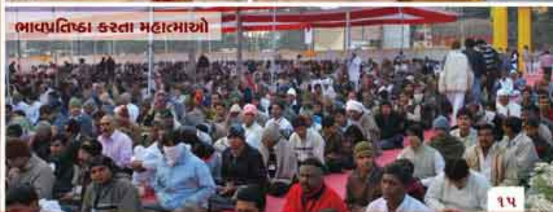
ભાવપ્રતિષ્ઠા કરતા મહાત્માઓ