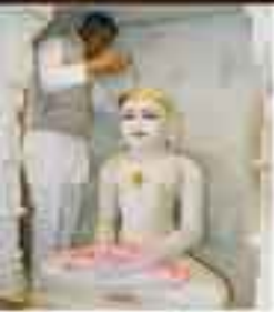
ભગવાન પાર્શ્વનાથ - મહાવીર