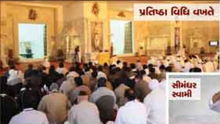
પ્રતિષ્ઠા વિધિ વખતે