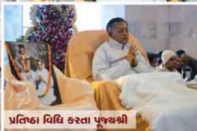
પ્રતિષ્ઠા વિધિ કરતા પૂજ્યશ્રી