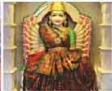
પાંચાગુલિ ચક્રિણી દેવી