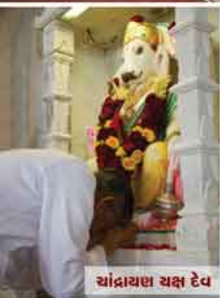
ચાંદ્રાયણ ચક્ષુ દેવ