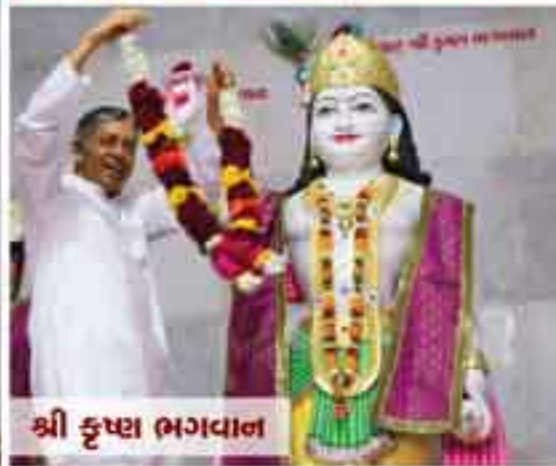
શ્રી કૃષ્ણ ભગવાન