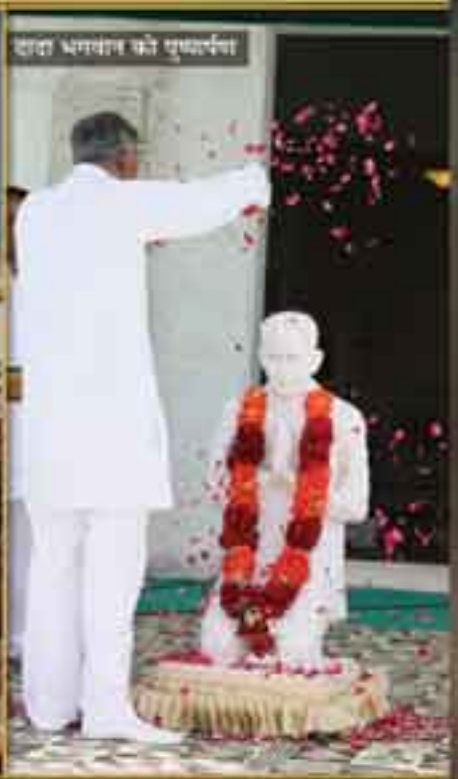
दादा भगवान को पुष्पार्पण