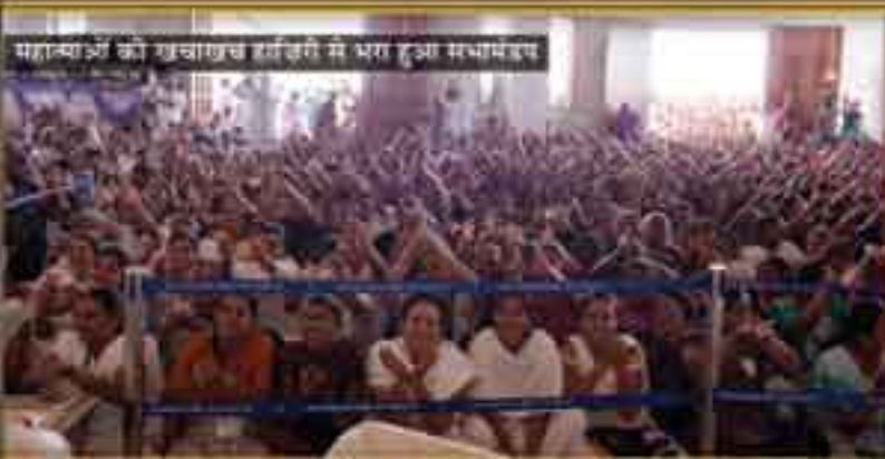
महास्वाश्री की शिवालय हरिद्वारे में भरा हुआ सभामंडप