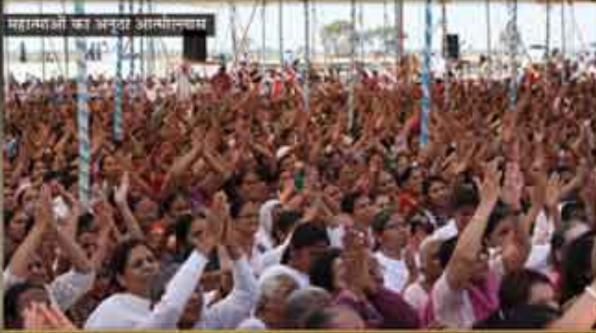
महात्म्याओं का अनुदा आत्मगानधाम