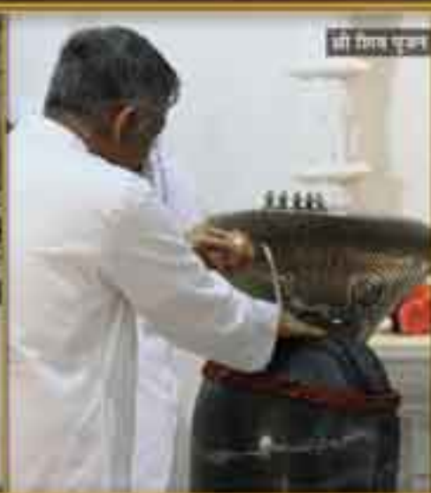
श्री विष्णु पूजन