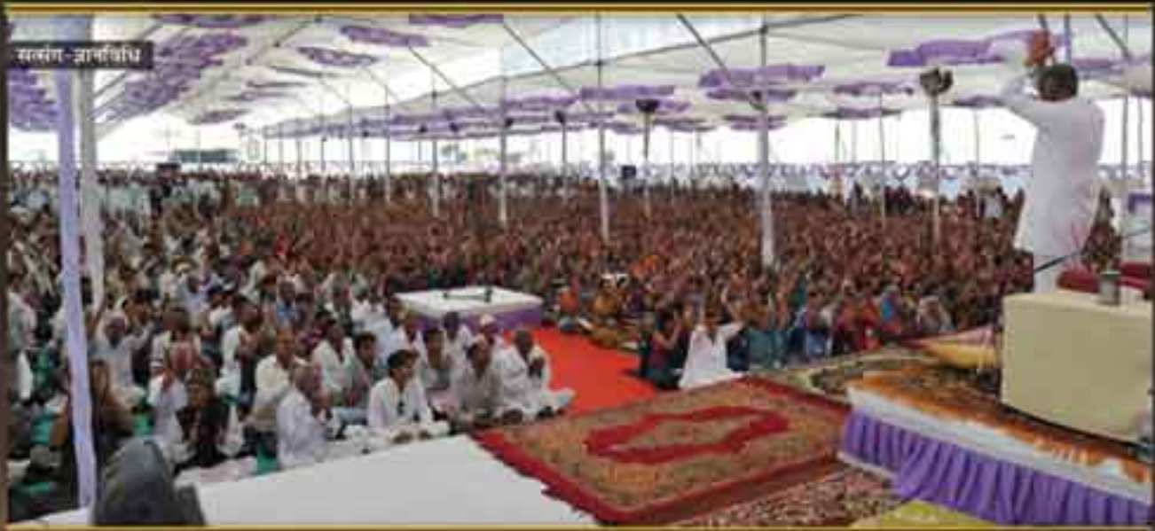
सादाबाणी - ज्ञानविधि