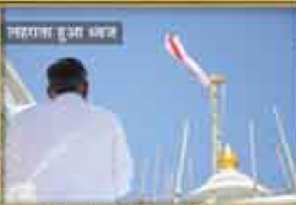
सदरगत हुआ भजन