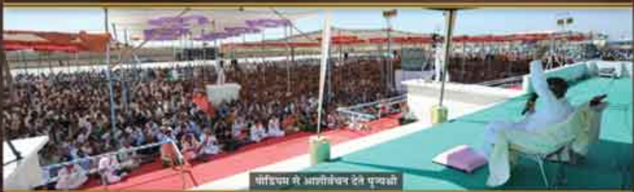
मोक्षिणम से आशीर्षकन देते पुन्यश्री