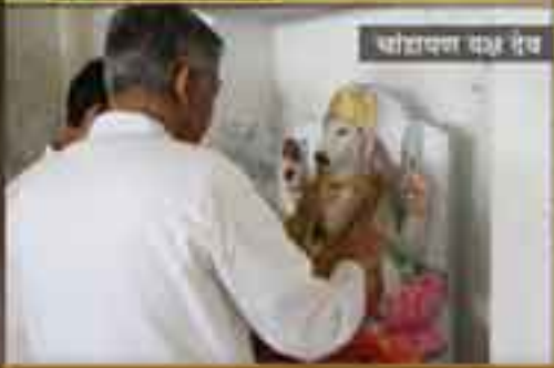
श्रीदादापण मन्त्र देव