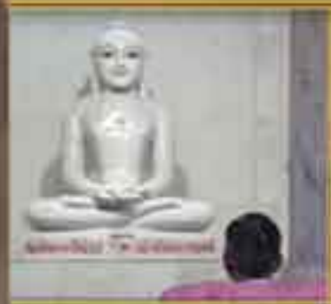
आजोबाई जी अज्ञानमोक्ष