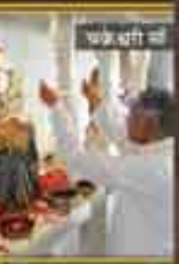
श्रीश्री श्री मं