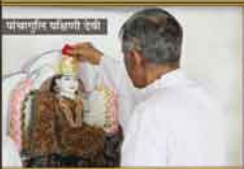
श्रीहनुमान् दादावाणी देवी