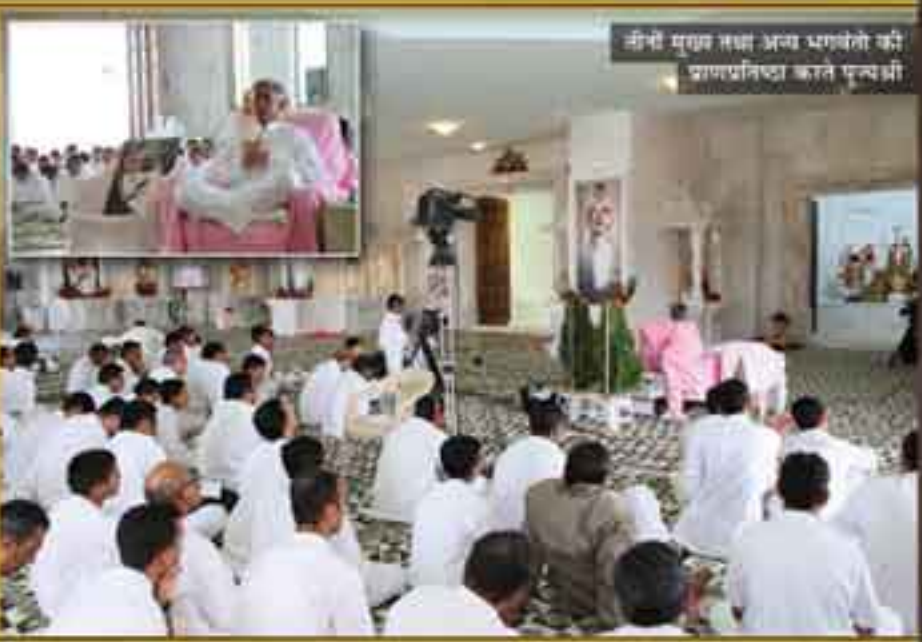
जी-सी मुख्य तथा अन्य भगवतों की प्राणप्रतिष्ठा करते पुन्यश्री