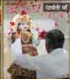
श्रीश्री श्री मं