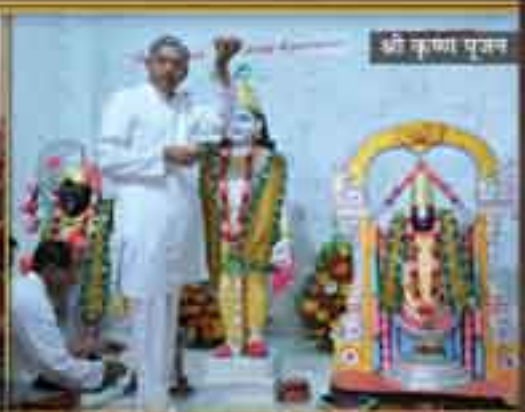
श्री कृष्ण पूजन