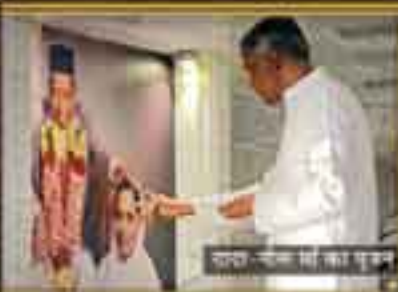
दादा-दादी मं का पूजन