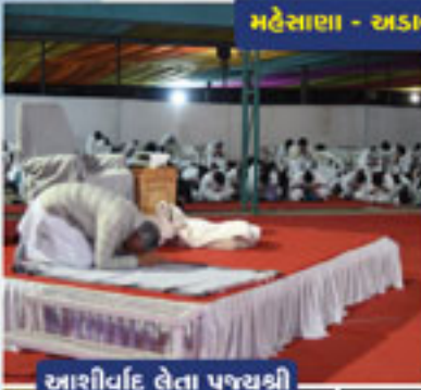
આરસીવીદ લેતા પૂજ્યશ્રી

મહેસાણા - અડાલજ : પૂજ્યશ્રીનો 52મો જ્ઞાન દિવસ : 6 માર્ચ