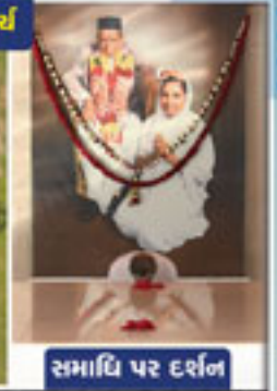
સમાધિ પર દર્શન