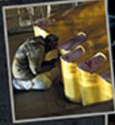
ભારતિયાજી ભગવાનના પાસે ભક્તિ