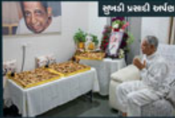
સુભદ્રા પ્રસાદી સર્પલ