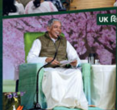
UK સિમિર - પોન્ટેન્સ