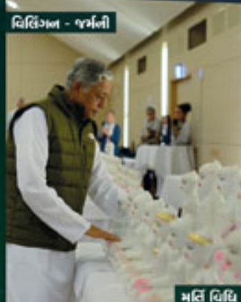
વિલિંગ્ટન - જર્મની