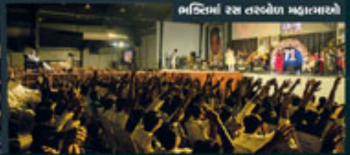
ભવિષ્યાં રસ તરબોળ મહાત્માઓ