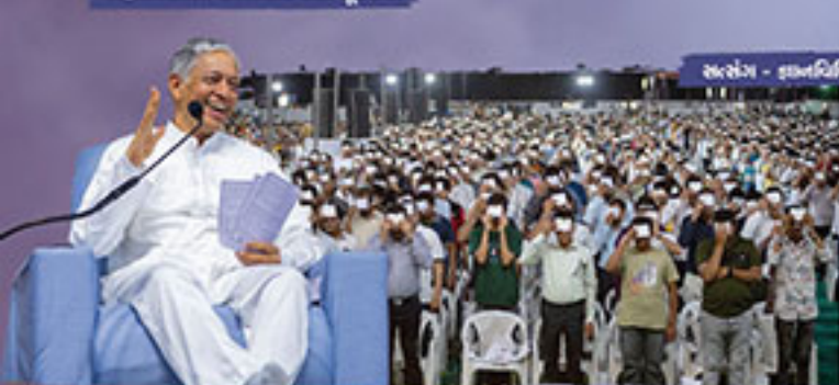
સુરતેન્ન - શબ્દચિત્ર